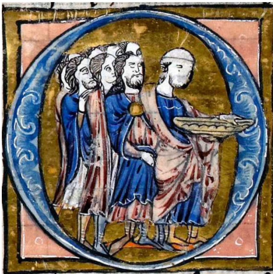
Joseph d'Armathie et ses compagnons emportant le Graal de Palestine

Transports : liaisons quotidiennes depuis Paris-Bercy jusqu'à Sermizelles-Vézelay, durée moyenne 2h30. Bus de Sermizelles à Vézelay (9km) pour certains trains. Nous consulter pour les horaires ou s'adresser à l'office du tourisme vezelay@destinationgrandvezelay.com