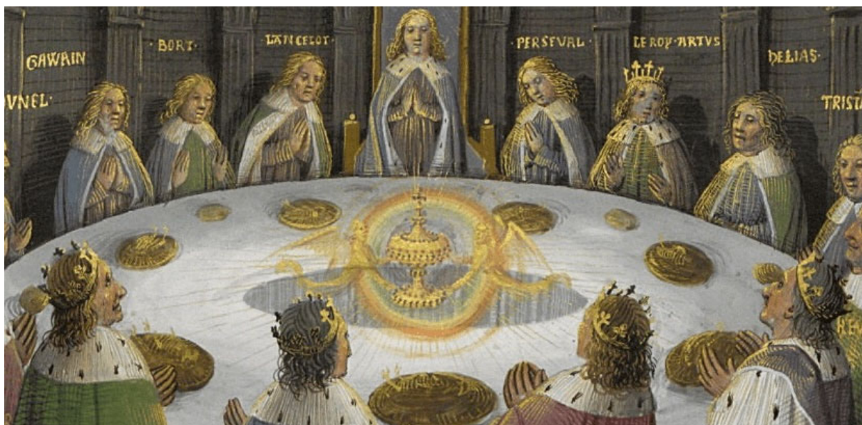
Le Roi Arthur et les chevaliers de la Table Ronde réunis autour du Graal

Accompagné d'une lecture symbolique de la Madeleine de Vézelay