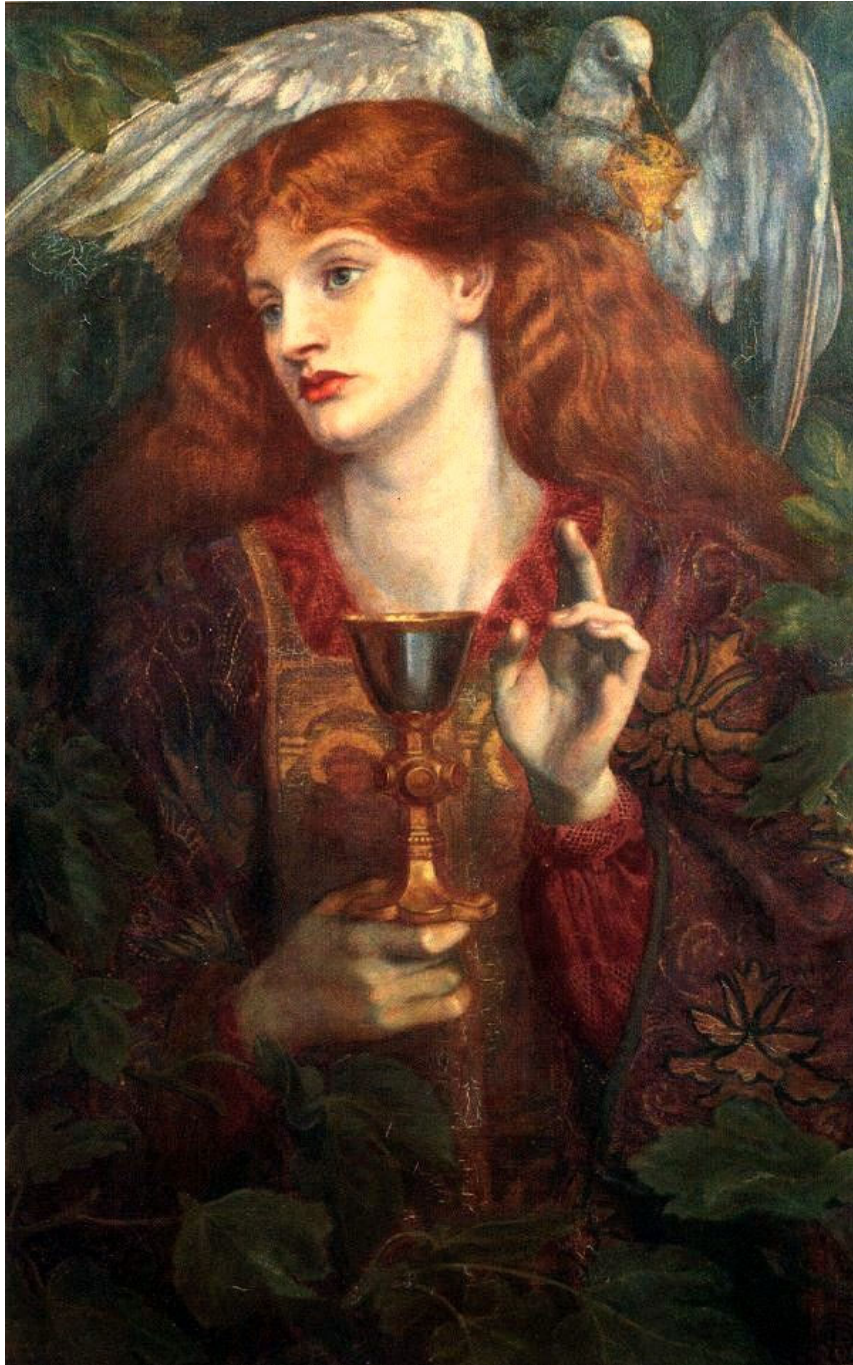
Dante Gabriel Rossetti, la demoiselle du Saint-Graal (1874)