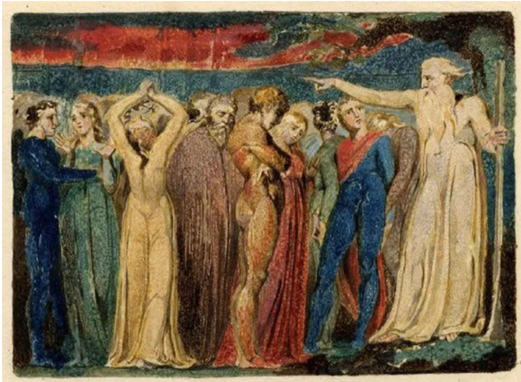
William Blake, Joseph d'Arimathe prêchant aux Britanniques (1794)

Vendredi 6 décembre 15h-19h, Samedi 7 décembre 9h -12h et 13h30 – 18h30, Dimanche 8 décembre 9h-12h et 13h30 -17h